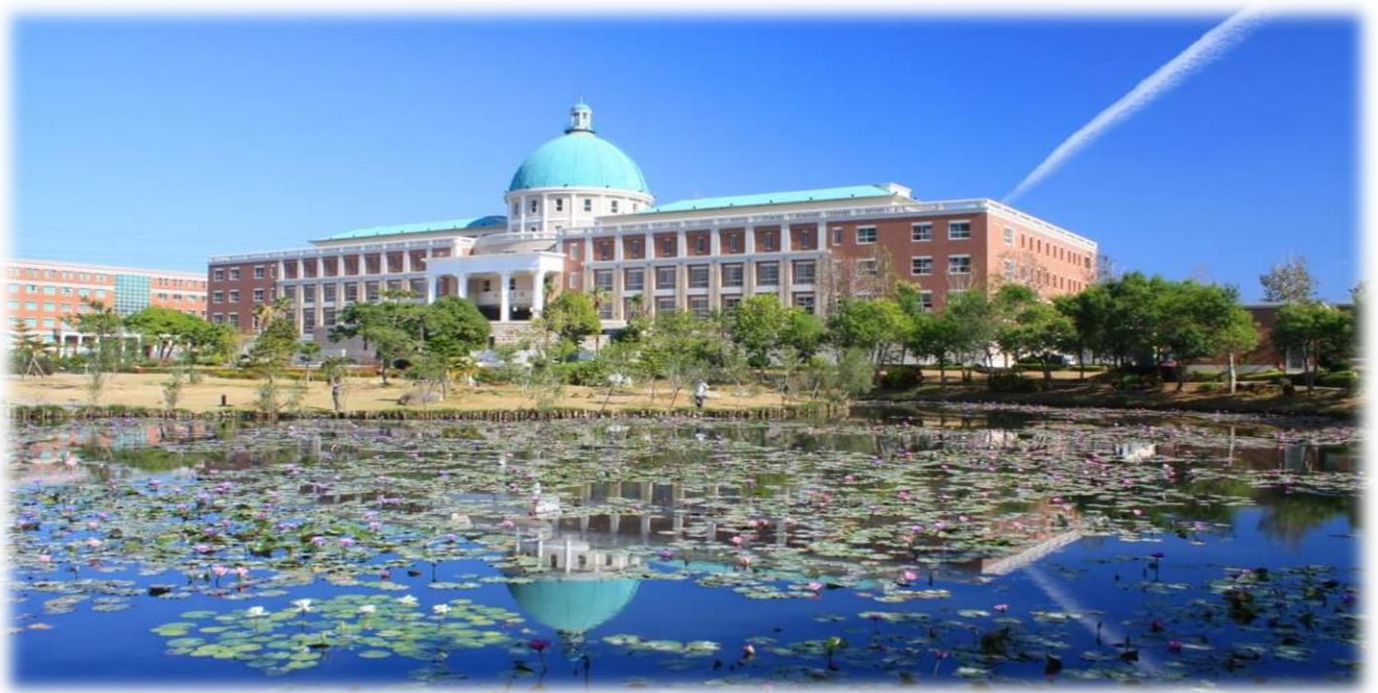
圖：就讀亞大，就是就讀一所「綜合大學」+「醫學大學」+「國際大學」