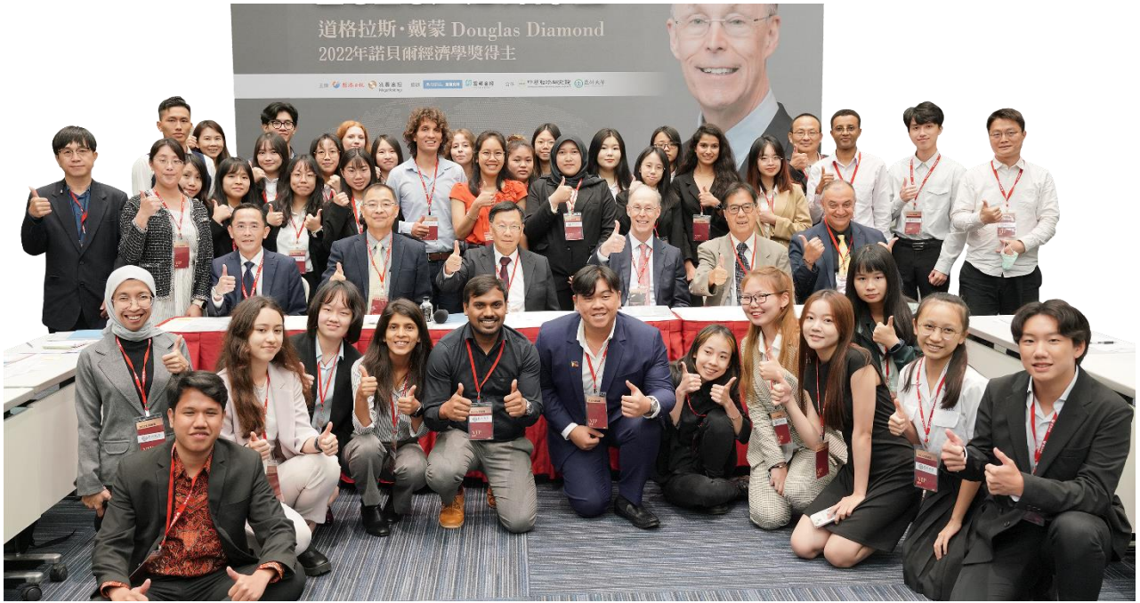
圖：禮聘多位國際級大師蒞校講學，師生可親自向大師請益!每年定期邀請諾貝爾得獎者舉辦大師論壇。