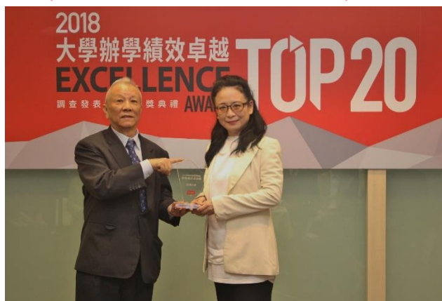
(圖：大學辦學績效 TOP20，亞大全台第 6 名！)

校址：台中市霧峰區柳豐路 500 號 招生諮詢專線：04-23323456#3132~3135 網址： http://rd.asia.edu.tw