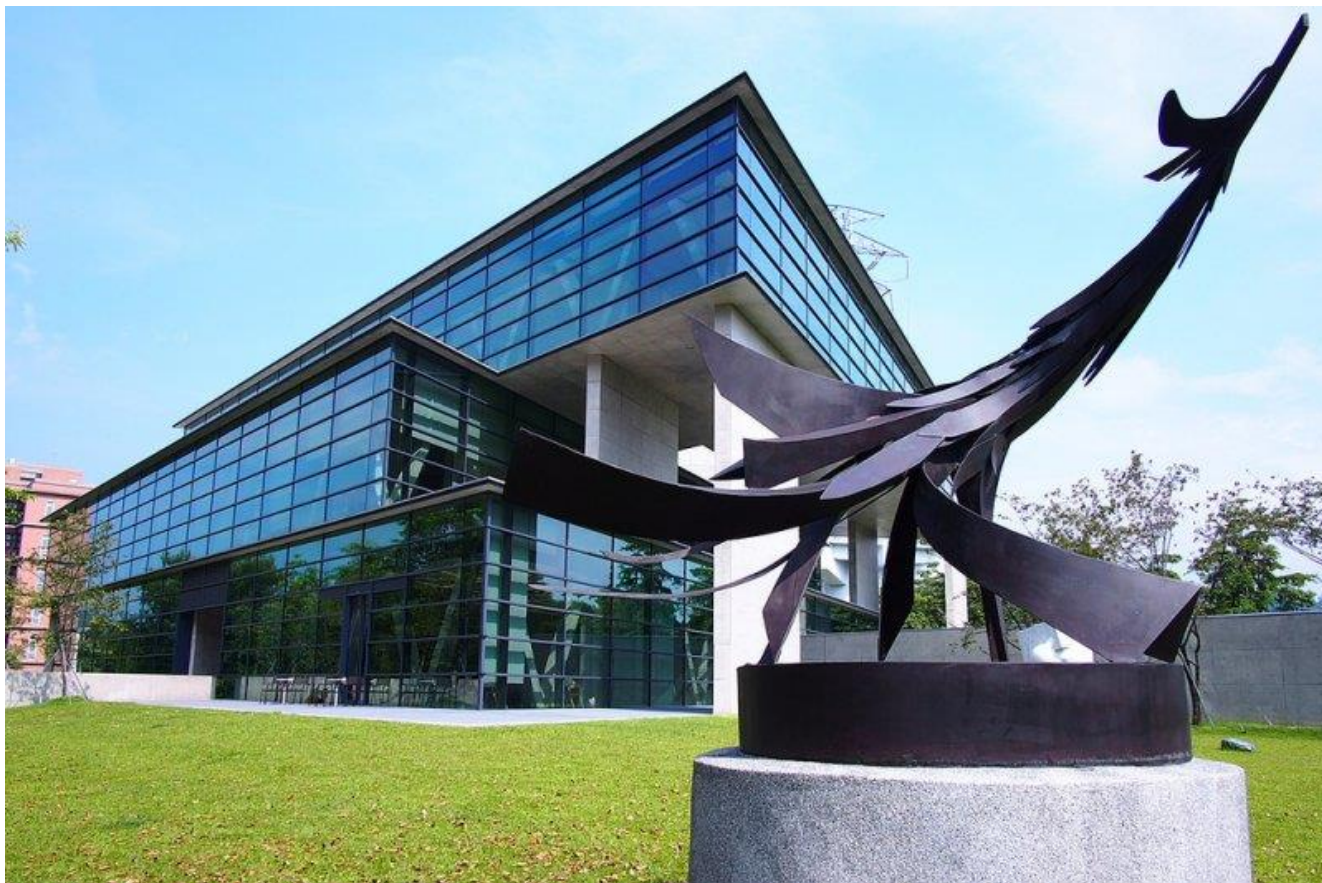
圖：中國時報舉辦「大專校院校園風景網路人氣票選」亞大安藤美術館入選全台校園十大美景！