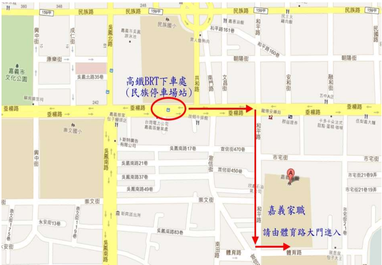
附圖一 承辦學校位置圖