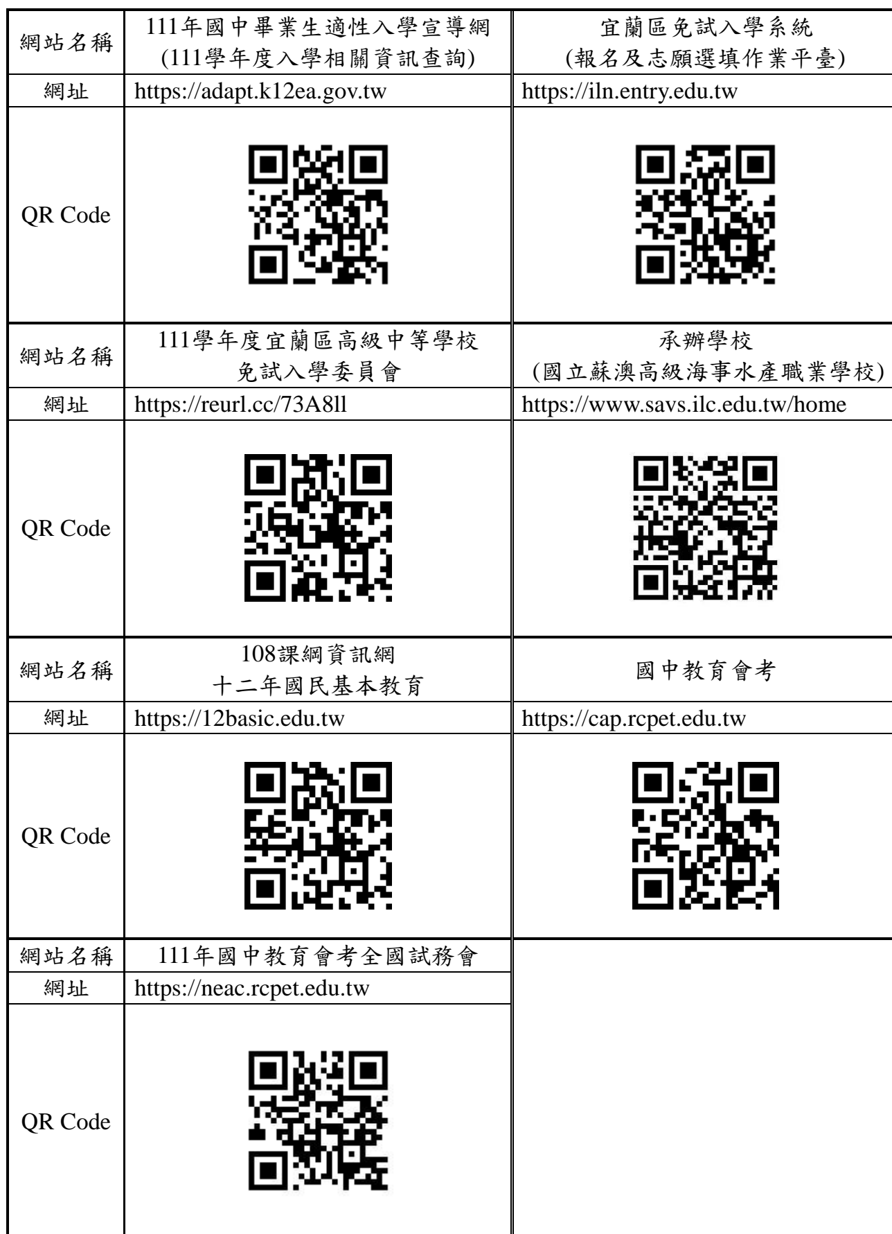
111學年度宜蘭區高級中等學校免試入學參考網站一覽表