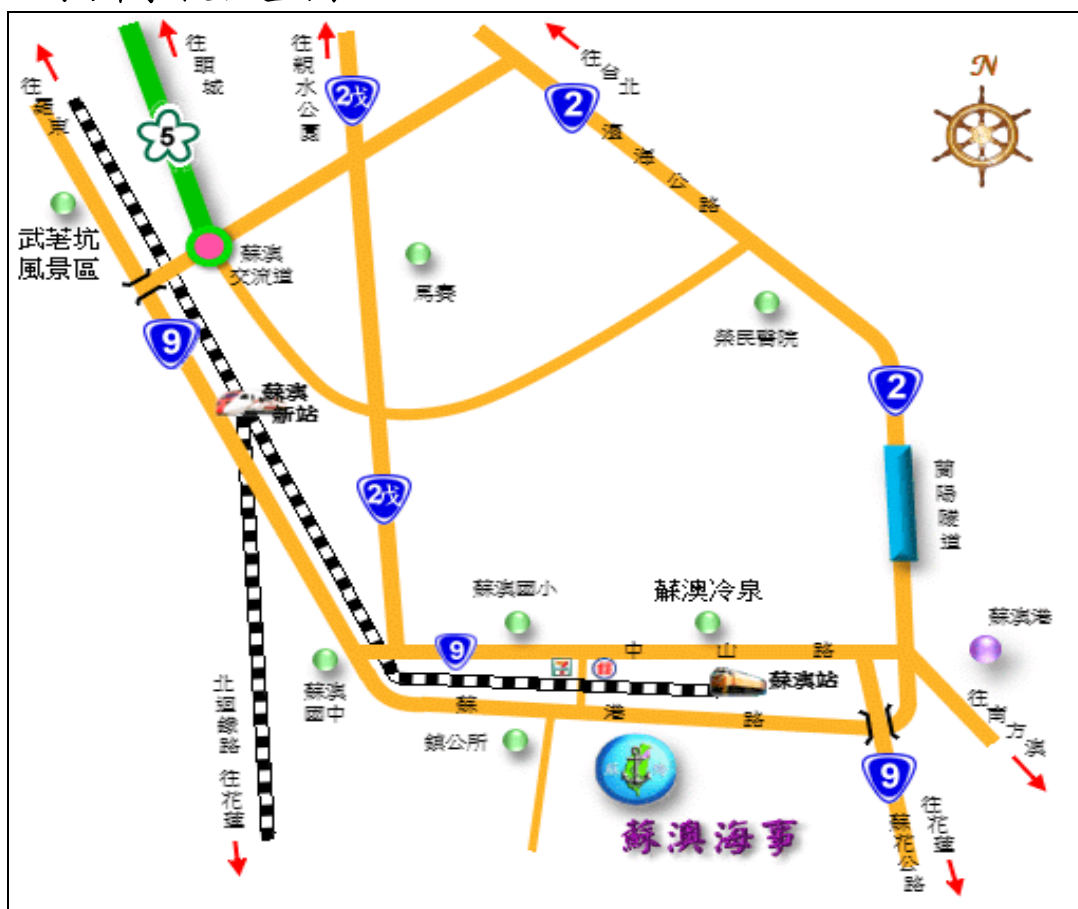
附圖一 承辦學校位置圖