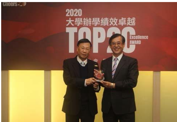
(圖：大學辦學績效 TOP20，全台第 9 名！)