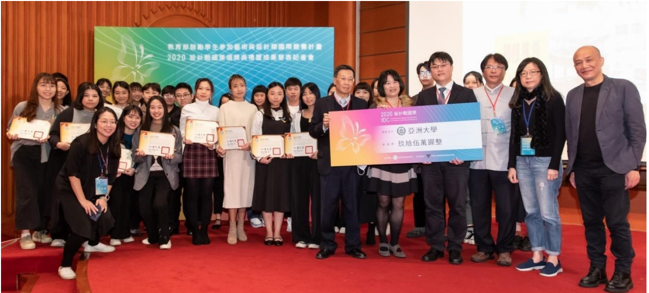
圖：亞洲大學獲國際設計競賽7年高教第一！