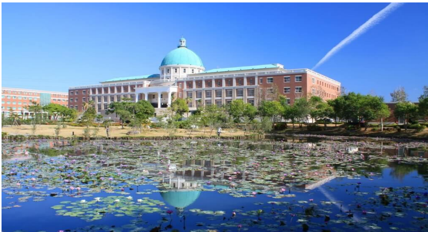
圖：就讀亞大，宛如就讀一所「綜合大學」+「醫學大學」+「國際大學」