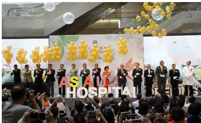
亞洲大學附屬醫院