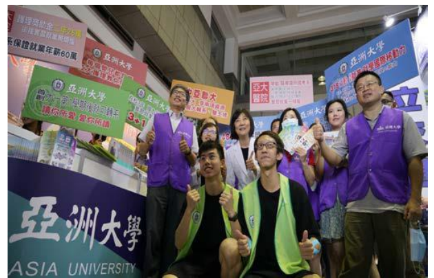
(圖：招生處行政團隊參加大學博覽會)

校址：台中市霧峰區柳豐路 500 號 招生諮詢專線：04-23323456#3132~3135 網址： http://rd.asia.edu.tw