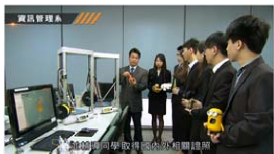
輔導同學取得國內外相關證照