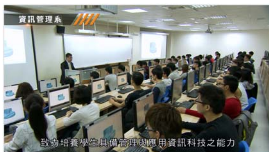
致力培養學生具備管理與應用資訊科技之能力