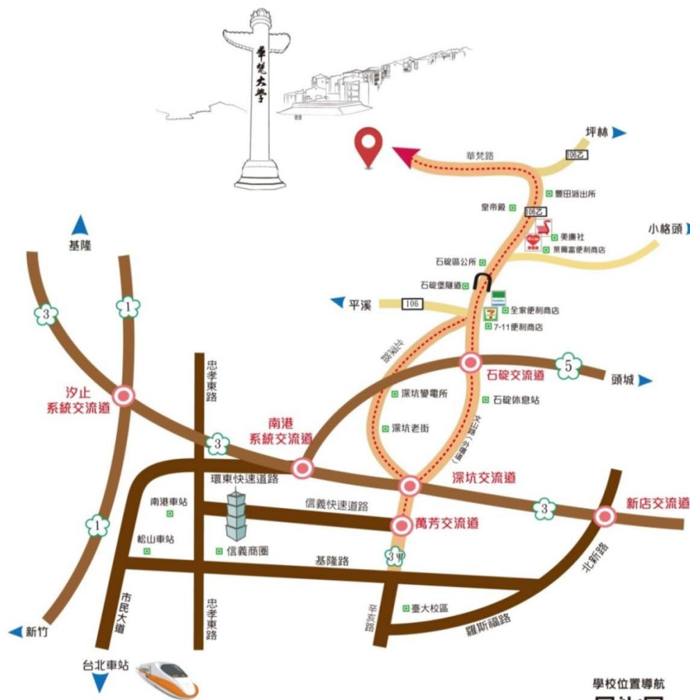
■ 華梵大學交通路線圖